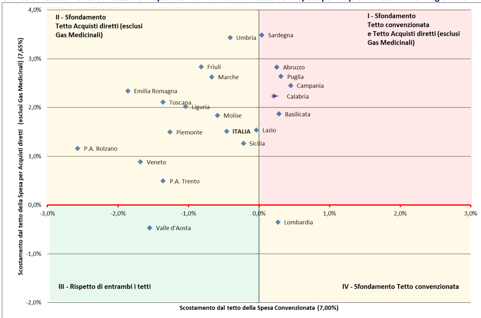
Grafico 3 – Scostamento dal tetto della Spesa convenzionata e dal tetto della Spesa per Acquisti diretti – Valori regionali e nazionale