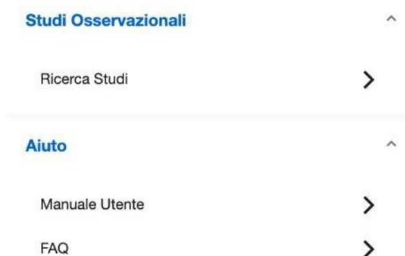
Figura 3 - Menu utenti esterni