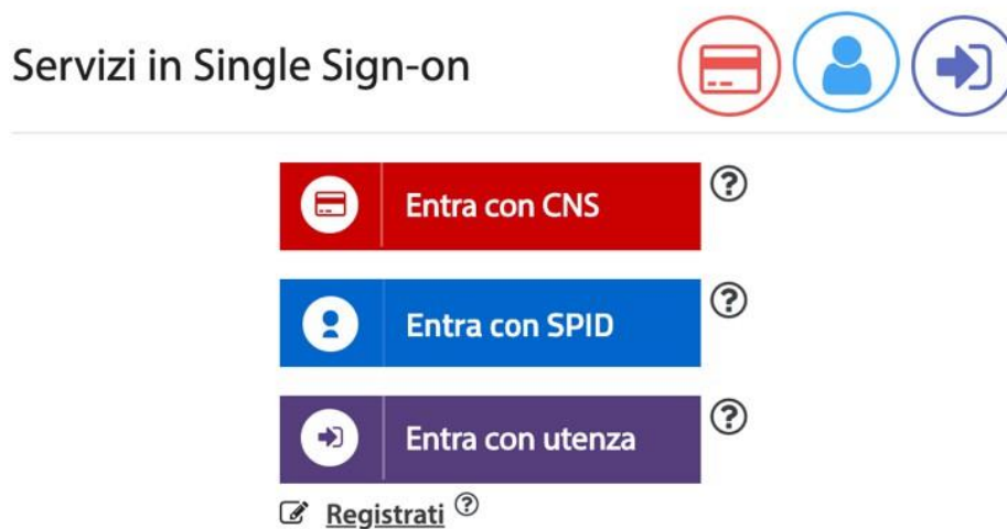
Figura 1 - Accesso al sistema

Il sistema RSO sarà accessibile solo ad utenti registrati ed abilitati all'uso dell'applicazione e potranno effettuare l'accesso mediante CNS, SPID o utenza registrata al portale dei servizi AIFA.