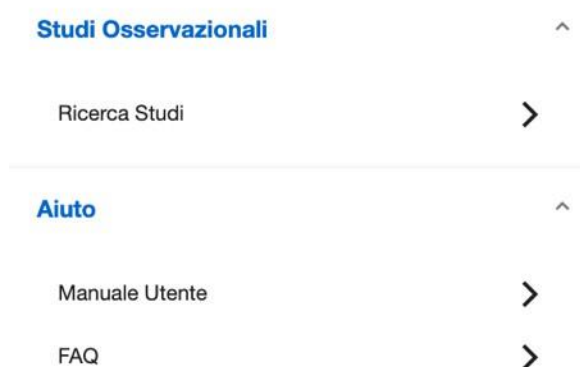
Figura 3 - Menu utenti esterni